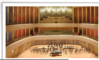
Művészetek Palotája 芸術宮殿