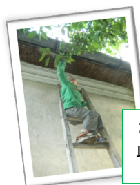
さくらんぼの収穫