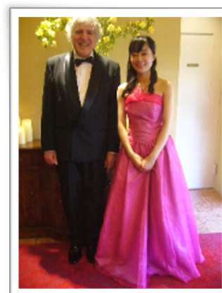
来日したエンドレ先生と